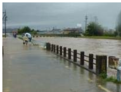
平成26年10月出水状況