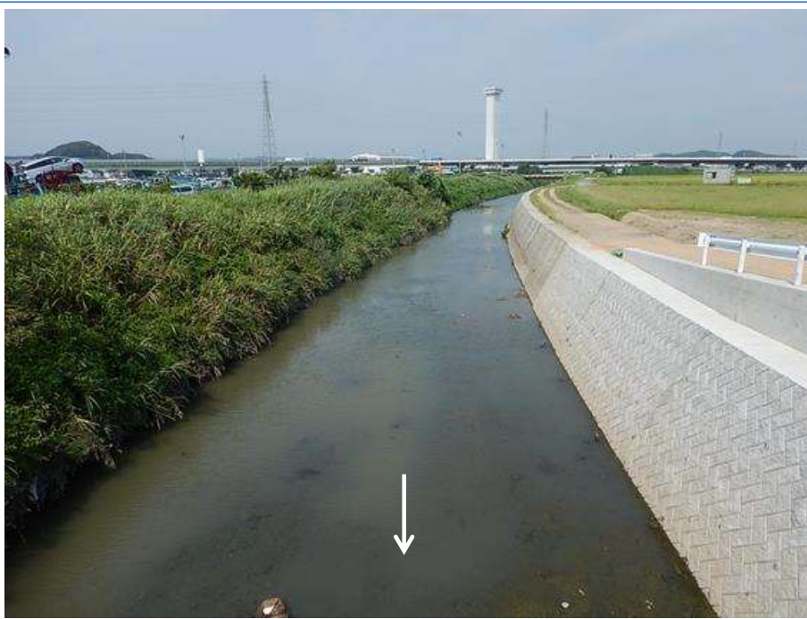
新旭橋から上流を望む