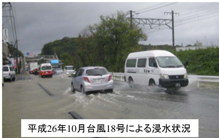
平成26年10月台風18号による浸水状況