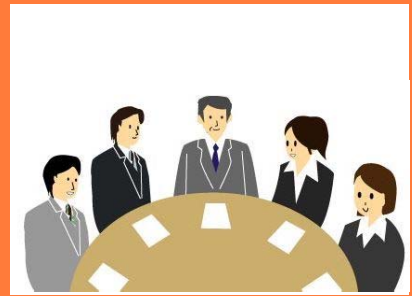
災害対応について関係者で振り返り