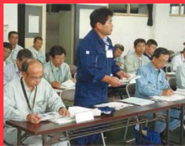
気象状況の解説・助言