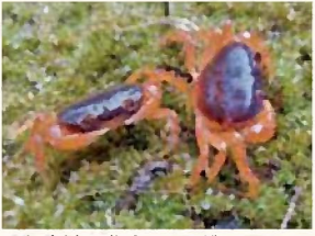
▲上流域に住むサワガニ

同じサワガニなのに住む場所の日照や食べ物・地質で体色は変わりますが、水質の指標とされるだけあって比較的水がきれいな方が明るいオレンジ色をしています。写真は森町の上流域と中流域に住むサワガニです。日本固有種で、オスは片方のハサミが大きいのが特徴です。食用にもなるサワガニですが、器用に横歩きで岩を登る姿を眺めるのも楽しいですよ。