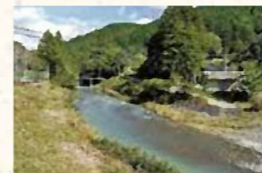
▲写真1. 吉川の河床(森町鍛冶島)