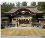
▲葺き替え前の拝殿

奥宮興誓戸神社が鎮まる本宮山が起点となる太田川の源の一つの宮川が流れる小國神社では、天皇陛下御即位記念として、御本殿以下社殿のお屋根の葺き替え工事が、六十年ぶりに今年一月から四年の歳月をかけ、神社境内の檜から檜皮を取り、整え、屋根が葺かれます。檜皮葺は、日本特有のもので千三百年にわたって継承される優雅な造形美と日本の風土に適した伝統技法です。変わりゆく姿を一目ご覧になってはいかがでしょうか。