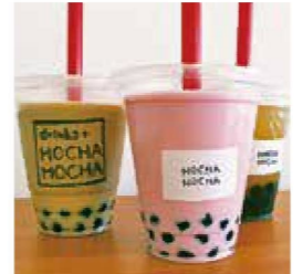
▲タピオカドリンク各種

【メニュー】タピオカドリンク(冷・温合わせて30種以上)、紅茶、ジャスミンティー(冷のみ)、台湾茶、コーヒー、ソーダ各種など399円(税込)~