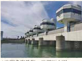
▲市民を守る岩、仿僧川水門

太田川の河口は憩いの場です。夏には、はまぼう公園でハマボウの黄色い花を見ることができ、野鳥観察舎では四季折々の渡り鳥も観察できます。秋にはのんびりハゼ釣りも楽しめます。この河口付近には仿僧川が太田川に流れ込む合流点があり、その合流点には仿僧川水門があります。この水門は地震により津波が川の奥深くまで遡上し甚大な被害をもたらすのを未然に防ぐ為に昭和54年に建設されました。警戒宣言発令時には水門の操作を袋井土木事務所から監視カメラで安全を確認し遠隔操作で行います。もちろん水門では回転灯やスピーカーで周囲に注意を促します。私達は、この水門が使われない事を願いますが警戒宣言発令時には水門に近づかないように注意したいと思います。