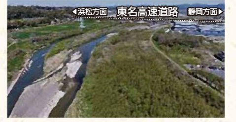
▲伐採・掘削作業前(袋井市横井)

近年、想定を超える洪水により重要なインフラが機能を喪失することで、国民の生活や経済活動に大きな影響を及ぼす事態となっています。これらの教訓を踏まえ、袋井土木事務所では、インフラが自然災害時にその機能を維持できるように対策を進めています。 ① 伐採・河道掘削 樹木繁茂・土砂堆積による流下阻害や局所洗掘等によって洪水氾濫の危険性が特に高い区間について、樹木伐採・掘削等を行うことで、氾濫を防止する。 ② 堤防天端舗装 越水等が発生した箇所において、決壊までの時間を少しでも引き延ばす堤防構造とするため、堤防天端をアスファルト等で保護し、堤防への雨水の浸透を抑制するとともに、越水した場合には法肩部の崩壊の進行を遅らせることにより、決壊までの時間を少しでも延ばす。 また、これらハード面の対策だけでなく、市町が実施する洪水ハザードマップの作成等の支援や危険管理型水位計の設置を進めています。その観測データは、サイボスレーダーで提供を開始しています。