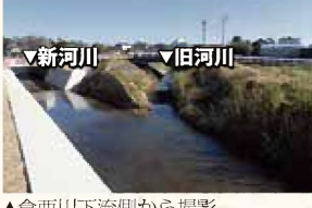
▲倉西川下流側から撮影 写真奥から手前に流れています。

現在、倉西川は、神明中学校の西側にある道路の横を流れており、神明中学校正門から暗渠で道路を横断し、道路反対側に流れを変えて、松原橋まで少しカーブを強めて流れています。新駅「御厨駅」周辺の土地区画整理事業では、神明中学校正門から暗渠とせず、ますますスムーズな流れとなる整備が進められています。松原橋からは、今まこと変わらなず、福田亀橋・浮宮橋のそれぞれで、直角に流れを変えます。その後、絶滅危惧種の「かわはたもろこ」が見つかった古川へと合流します。