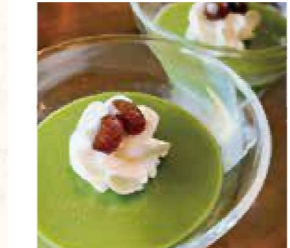
▲抹茶プリン 300円(税込)3月下旬頃~

おすすめは、地元のブランド牛「森の姫牛」を使用した太田川ダムカレー。春、夏、秋、冬とシーズンごとにトッピングが違うこだわりぶり。「森の姫牛」の特徴は、肉質がやわらかく甘味のある上質な赤身。その名の通り雌牛のみが「森の姫牛」を名乗ることができる。その他、パティシエ特製のいどり豊かな旬のデザートが特徴だ。