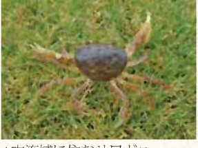
▲中流域に住むサワガニ