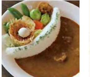
▲太田川ダムカレー(春)1,160円(税込)

【メニュー】かわせみ御膳1,200円、森の姫牛ポロネーゼ950円、森の姫牛カルボナーラ950円、おろしそば850円、本日のケーキ400円など。(全て税込)