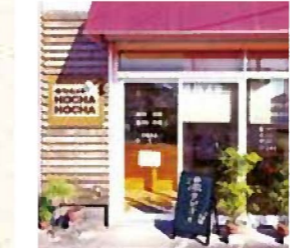
▲ポップな看板が目印の外観

台湾で人気のドリンクスタンド。「気軽にテイクアウトできるお店を地元にも」と、台湾居住経験のあるオーナーがお店を開業。おすすめは、本場台湾産のタピオカを使用したドリンク。タピオカは黒糖など数種類の砂糖をブレンドした、特製のシロップに漬けており、もちもち感がある鮮度の良いものだけを使用。その他ジャスミンティー、台湾茶などバラエティー豊かだ。