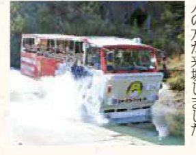
▲水陸両用バス 入水の瞬間

2019年11月23日、「太田川ダム管理10周年記念イベント」が開催されました。水陸両用バスによるかわせみ湖遊覧、サイクリング、ウォーキング、地元特産品等の販売など各種イベントが催され約1千人の方が来場しました。