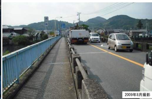
↑旧森川橋の状況 ←上空写真(仮橋完成,旧橋撤去前)