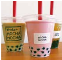
▲タピオカドリンク各種

【メニュー】タピオカドリンク(冷・温合わせて30種以上)、紅茶、ジャスミンティー(冷のみ)、台湾茶、コーヒー、ソーダ各種など399円(税込)~