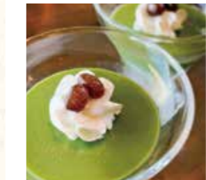
▲抹茶プリン 300円(税込)3月下旬頃~

おすすめは、地元のブランド牛「森の姫牛」を使用した太田川ダムカレー。春、夏、秋、冬とシーズンごとにトッピングが違うこだわりぶり。「森の姫牛」の特徴は、肉質がやわらかく甘味のある上質な赤身。その名の通り雌牛のみが「森の姫牛」を名乗ることができる。その他、パティシエ特製のいどり豊かな旬のデザートが特徴だ。