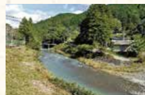
▲写真1. 吉川の河床(森町鍛冶島)