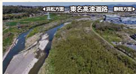
▲伐採・掘削作業前(袋井市横井)

また、これらハード面の対策だけでなく、市町が実施する洪水ハザードマップの作成等の支援や危険管理型水位計の設置を進めています。その観測データは、サイボスレーダーで提供を開始しています。