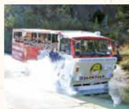
▲水陸両用バス 入水の瞬間

2019年11月23日、「太田川ダム管理10周年記念イベント」が開催されました。水陸両用バスによるかわせみ湖遊覧、サイクリング、ウォーキング、地元特産品等の販売など各種イベントが催され約1千人の方が来場しました。