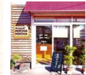
▲ポップな看板が目印の外観

台湾で人気のドリンクスタンド。「気軽にテイクアウトできるお店を地元にも」と、台湾居住経験のあるオーナーがお店を開業。おすすめは、本場台湾産のタピオカを使用したドリンク。タピオカは黒糖など数種類の砂糖をブレンドした、特製のシロップに漬け込んでおり、もちもち感がある鮮度の良いものだけを使用。その他ジャスミンティー、台湾茶などバラエティー豊かだ。