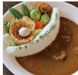
▲太田川ダムカレー(春)1,160円(税込)

【メニュー】かわせみ御膳1,200円、森の姫牛ポロネーズ950円、森の姫牛カルボナーラ950円、おろしそば850円、本日のケーキ400円など。(全て税込)