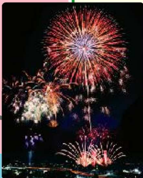
ふくろい遠州の花火