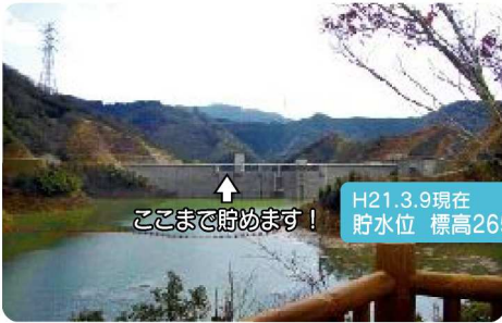
↑ ここまで貯めます！

太田川の治水・利水・環境用水の確保の目的で、建設中の太田川ダムについてご紹介します・・・