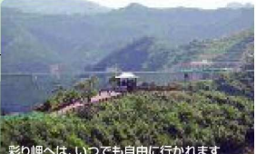
彩り岬へは、いつでも自由に行かれます 彩り岬は、太田川と杉沢の合流点にある半島。先端には展望台があって360度かわせみ湖が見渡せる唯一の場所です！