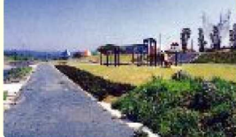
虹のささやき公園