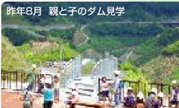
昨年8月 親と子のダム見学

片吹の郷には、水没地から移転された大まら様が祀られています。大まら様の御神体は、男性のシンボル。ちょっと話題のスポットです。