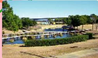
原野谷川親水公園

ふくろい遠州の花火でおなじみの公園。芝生広場や冒険の池、湿性植物生態園、ハーベキユーのできるティキヤンプ場、遊具などがあり、多くの人が水辺に親しめる公園です。近くに愛野公園もあり、緑が多く、ハードウオッチングにも最適です。家族で春をさがしに、のんびり出かけてみてはいかがでしょう。〈森町 辻 克美〉