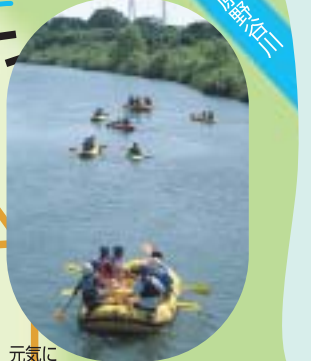
元気に太田川を下る