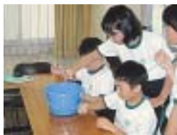
バックテストをする生徒達

6月16日、城山中学校の「今ノ浦川に関する総合学習」の授業に参加しました。授業は1年生13名が受講し、今ノ浦川についての想い等を一人ずつ発表した後、今ノ浦川の水がどの程度汚染されているか実体験してもらったために、バックテスト(簡易キットによる水質検査)を実施しました。 当日はあいにくの雨天でしたが、水質検査により今ノ浦川の水の汚れを実感した様子でした。 〈袋井土木事務所 石田安秀〉