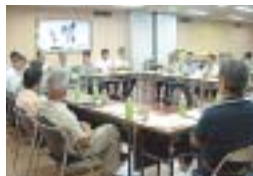
各団体の活動内容を紹介

去る8月16日、太田川流域を活動拠点としている12の団体が集まって、太田川流域ネットワークワーキング(仮称)の準備会が、袋井土木事務所で開催されました。 このネットワークワーキングは、流域のあり方や子供達の将来について、あるいは意識の共有化や情報交換の場として、様々な活動が期待されています。 会議ではさらに活動グループを募り、民間団体と行政の協働によるシンポジウムを開催するなどの具体的な活動を通して、共通認識を醸成していくことが、大切なこととされています。 〈袋井市 渡瀬 儔〉