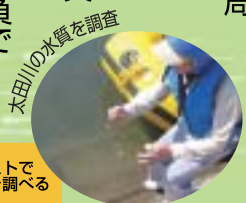
太田川の水質を調査