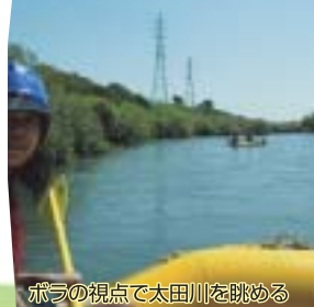
ボラの視点で太田川を眺める

9月18日(日)に、太田川の新明ヶ島橋の下から、河口のはまほう公園までの約7kmをインストラクターの指導を受けながら、カヌーとゴムボートで川下りをしました。