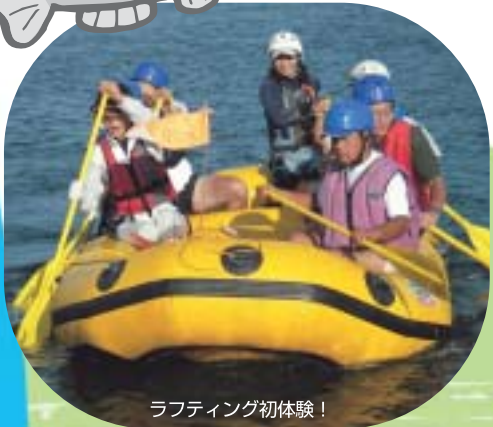
ラフティング初体験!