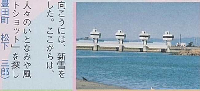
どことなくユニークな耐震水門