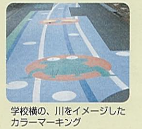
学校横の、川をイメージしたカラーマーキング

*ウォーキングには、今井公民館を起点に「かわせみコース(6.3km)」「虹のかけはしコース(6.4km)」があります。 *今井公民館へは、東名袋井ICより車で約5分。今井小学校北側。 *今井公民館 Tel.0538-43-3388