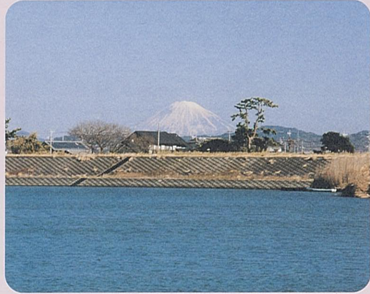
かなたに見えた富士山に感動