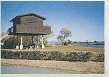
はまぼう公園内にある野鳥観察小屋