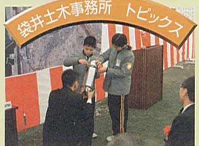
タイムカプセルに希望を込めて