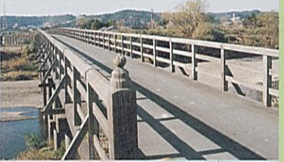
鳥田の蓬萊橋(ほうらいばし)を思わせる「新屋橋(あらやばし)」