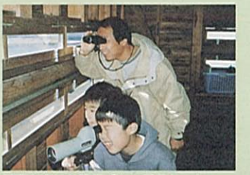
観察を楽しむ親子「あ、見えた!」