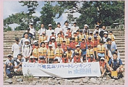
来年も参加したいネ