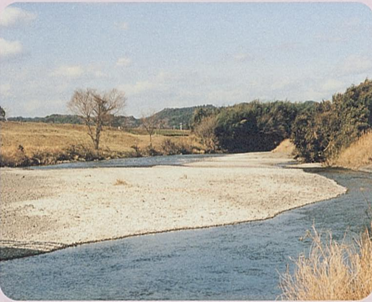
時も川もゆったり、ゆっくり

周知郡森町大日山に生まれた川は、いくつものまちを抜け、いくつもの流れと落ち合いながら遠州灘に至ります。その間、川はどんな景色をつくり、どんな命を育み、どんな人と触れ合うのでしょうか。 太田川の上流から下流、そして支流。身近な川の違う顔を知りたくて、流域を歩いてみることにしました。時と場所を変えながら、川はどんな姿で私たちを魅了してくれるでしょうか。