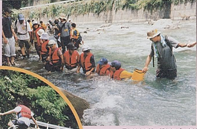
見かけより速い流れにビックリ

「川で遊んだことがないんだよ」。川の仕事に携わる者にとっては非常に辛い言葉です。 袋井土木事務所では、太田川流域の子どもたちに川のすばらしさを体験してもらいたい!という思いから、夏休みを利用して、「川発見隊」というイベントを開催しています。 2回目となる今回は、太田川下流で生活する小学生を対象に、太田川上流アクティビティ近郊でバーベキューキングを開催しました。 チームに分かれての水切り大会や鮎のつかみ取り大会は非常に盛り上がり、休憩時間になれば、淵へ飛び込んだり、流れに身を任せて泳いだりなど、子どもたちは、日常では体験することが出来ない貴重な経験ができたのではないかと感じています。 袋井土木事務所では、これからも引続き、子どもたちに川のすばらしさを伝えていきたいと思っています。 〔袋井土木事務所 遠藤和正〕