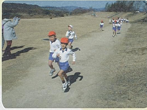
広々とした河川敷で元気いっぱい

今井地区の河川敷には、地域の人と子どもたちの思いがあふれています。 太田川に隣接する今井小学校の子どもたちは、持久走に、水遊びにと、川辺に第二の校庭を持っています。 川沿いにある3つの公園の名前も、子どもたちが考えました。特に「かけはし公園」建設には計画段階から参加。あずまの舗装デザインを市の鳥フクロウに決め、持ち寄った空きビンを取りサイクルした舗装材の設置まで手伝った