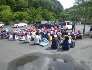
いよいよ、リバートレッキングが始まります。