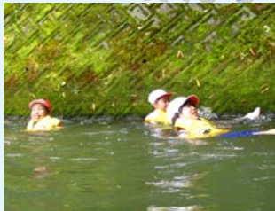
やっぱり川遊びが一番楽しい