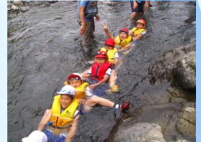
今度はチームで川流