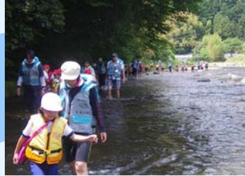
みんなで登っていきます。