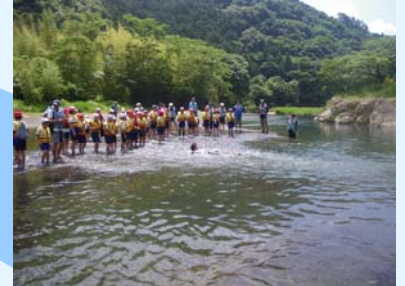
川流れ、ディフェンシブスイミング～

平成19年度より、袋井市立今井小学校の4年生児童（38名）を対象とした、総合学習のお手伝いをし、川と触れ合う活動を行っている。この活動は、『太田川の長さ、速さ、深さ、水辺の生物等』を肌で感じ、体験しながら学習していくことを目的としている。