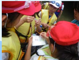
お勉強もしっかりやります。