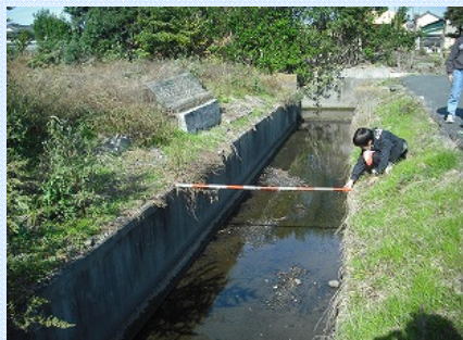
こんなに大きい水路も見つきました! 水害時に近づかないように注意しよう!