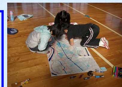
現地調査で発見した危険な箇所を地図に書いていきます。

今回のR-DIGを通して、いつも遊んでいる水路も、大雨のときにはとても危険な場所になることが分かったと思います。また、家族と水害について話をする、とてもいいきっかけになったと思います。