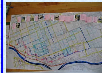
完成!!きれいにできました。