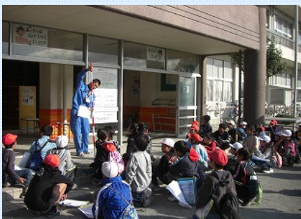
ポールの使い方をマスターして、危険な水路の大きさをたくさん測ろう!

4年生のみんなが毎日通る通学路で、もし洪水が起きたらどうなるのかを想像(Image)しながら、危険な箇所を調べました。危険な箇所を見つけたら、ポールを使い大きさを計測し、写真にとって記録に残しました。