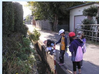
みんなで協力しながら危険な箇所をさがしています!