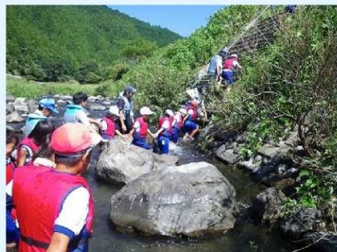
流されないように しっかりグリップ！