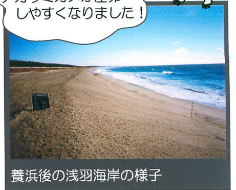
養浜後の浅羽海岸の様子