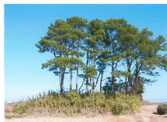
原野谷川河川敷に今なお残る「大囲堤」