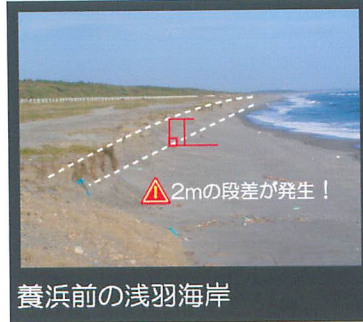
養浜前の浅羽海岸

ぼう僧川の河川工事で発生した土砂を、海岸の浸食が進み、アカウミガメの産卵が心配されている浅羽海岸の養浜砂として有効活用します。海岸の安全とアカウミガメの産卵場所を守ります。