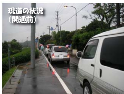
現道の状況 (開通前)