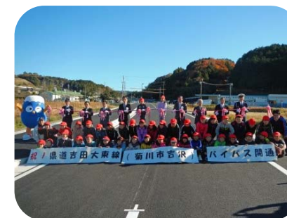
河城小学生4年生もテープカットに参加しました

この道路の開通により、菊川市の市街地から富士山静岡空港へアクセス向上、児童をはじめとした歩行者の安全性が向上します。