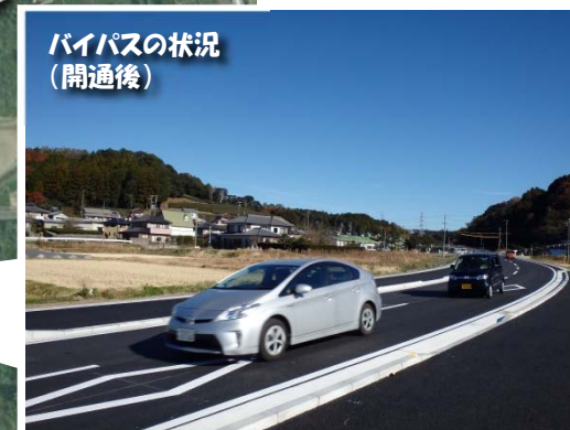
バイパスの状況 (開通後)