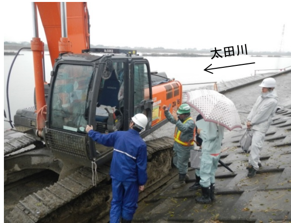
現場研修(平成26年11月) 学んだ工法について、「実際」に確認する。