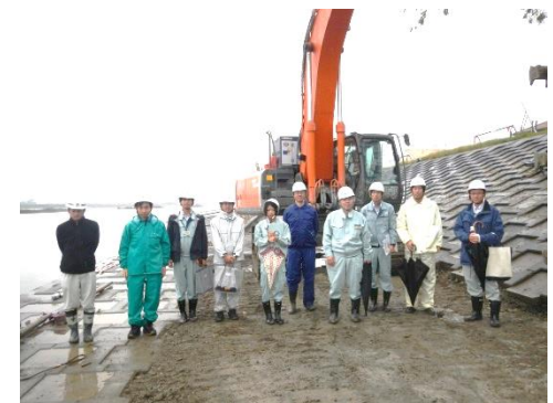
現場研修参加の皆さん