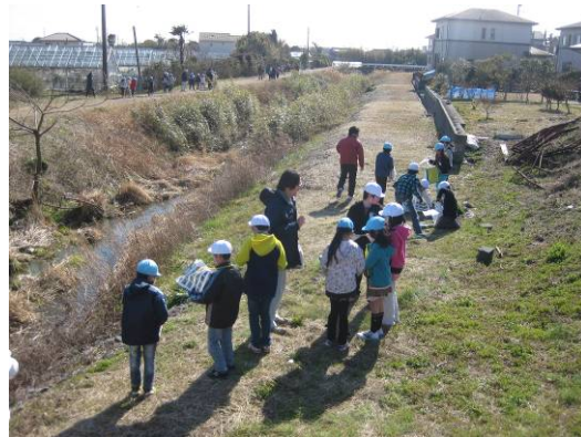
たくさんの「たから」を見つけました