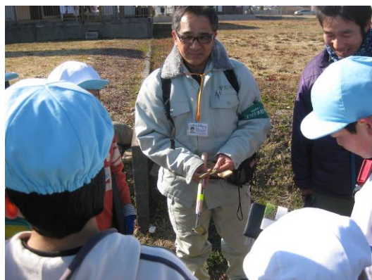
植物はかせに、草の名前を聞きました