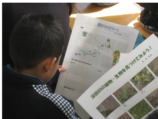
川にはなにがにいるのかな？

今回を含めて3回、児童たちと学習活動を行って、 深田川の未来像をまとめる 予定です。