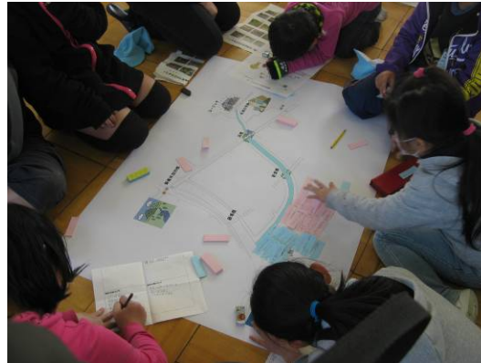
よいところ、わるいところをまとめました