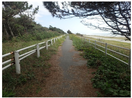
転落防止柵の更新

県道浜松御前崎自転車道の当区間において、安全で快適な自転車走行空間の創出を目的とした舗装や転落防止柵等のリニューアル工事実施により、全面通行止めいたします。